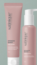
FINALIZE CREME E SÉRUM

A imagem do massageador é ilustrativa. O uso do massageador é uma recomendação opcional na rotina de cuidados capilares; este passo pode ser feito com os dedos ou omitido.